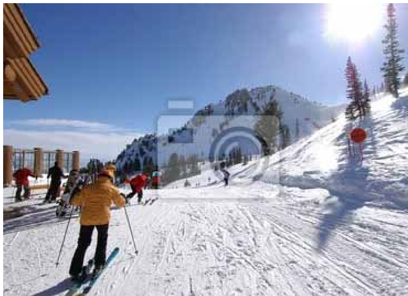
Северная Европа готова к снежной зиме 2012–2013. А Юго-Восточная Азия — к палящему солнцу и теплому морю в те же месяцы

Подготовьтесь к поездке заблаговременно. Туры на новогодние каникулы бронируются, как правило, задолго до начала путешествия. С визами тоже лучше поторопиться: в пик сезона консульские отделы буквально завалены работой. Позаботьтесь и о дополнительной медстраховке, предусматривающей повышенные риски в зимних видах спорта.