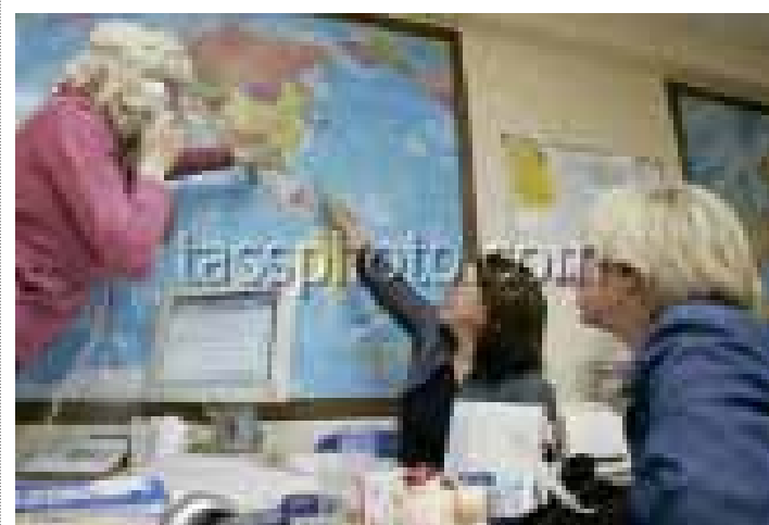
Оформляя медицинскую страховку в отечественной турфирме, обязательно наведите справки о страховой компании

под ее действие и увечья при занятиях дайвингом, горными лыжами, дельтапланом. Но это уже третье звено страховой цепочки — опциональные страховки. Спецстраховку можно оформить у подножия горы. Но лучше дома, у туроператора: в случае чего попадете под российскую юрисдикцию. Есть еще одна добровольная страховка — от невыезда (2–5 процентов от цены тура). Рекомендую! Могут отказать в визе (выдать ее с опозданием). Или вдруг заболел: на сморк не пройдет, лишь болезнь, связанная с госпитализацией. Получите же компенсацию и если не поедете, простите, из-за смерти близкого человека. Или если вас пригласят (выпеленного) для участия в следственных или судебных действиях. А вот вариант «меня начальник не отпустил» не работает — раньше надо было думать. И вообще подумать заранее о безопасности не мешает. Не экономьте на «путовицах» — «штаны» потеряете.